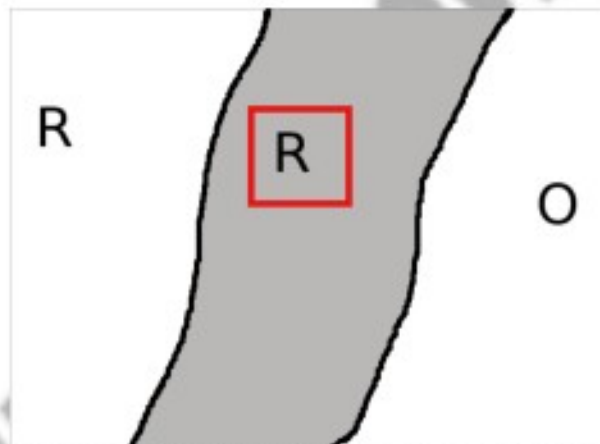
Illustration 3: Dans le cas d'un projet (rectangle) dans le trait de zonage (fond grisé), c'est la réglementation de la limite la plus contraignante qui s'applique (R) et cela jusqu'à la zone moins contraignante.